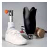
BYTTE AV FØTTER

Med Xtend Connect bytter du raskt fra en aktivitetsfot til en hverdagsfot. Du beholder samme hylse, slik at du slipper å ta med deg hele sett. Eller bytt raskt mellom utefot og innefot, selvsagt uten å forstyrre de viktige innstillingene.