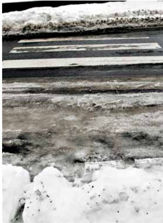
Et eksempel. Når et fotgjengerfelt virker ekskluderende, fordi det har barrierer i form av brøytekanter på begge sider av veien, kan det ikke sies å være universelt utformet.

Målet med kunnskapssammenstillingen er å få oppsummert relevant kunnskap om universell utforming. Evalueringen skal generere kunnskap om prosess og virkningene/resultatene av utvalgte tiltak og virkemidler. Rapporten skal også