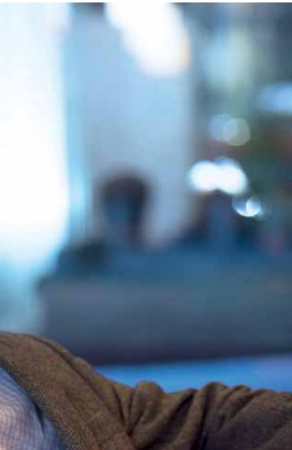
«...ken dumsnill eller gå på akkord med seg selv.»

En slags tidlig frontfigur i homofiles kretser, altså. «Den gangen var jeg en av de få tillitsvalgte i Unge Høyre som tonet flagg og var tydelig talsperson mot diskriminering og utenforskap.»