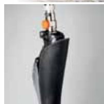
BYTTE AV KNELEDD