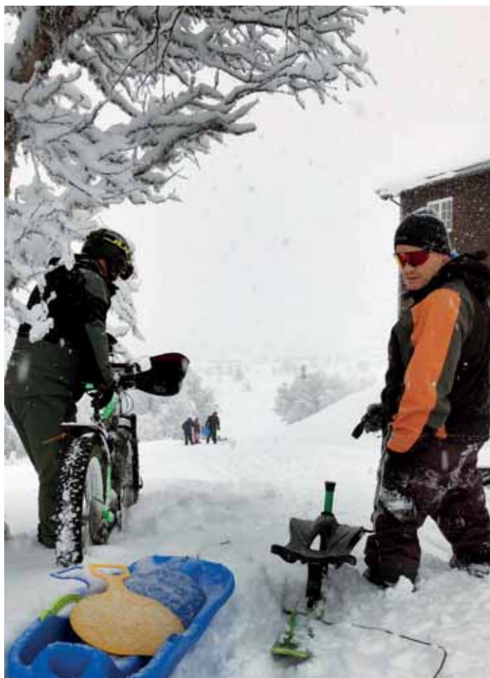
Sykkel, kjelke ... Mange muligheter til å boltre seg i snøen.

Litt av hemmeligheten er at han har en osseo-integrasjon. Da er det operert inn en bolt i benet som protesen festes direkte i. På den måten slipper han hylser