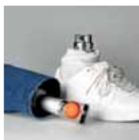
BYTTE AV BUKSE