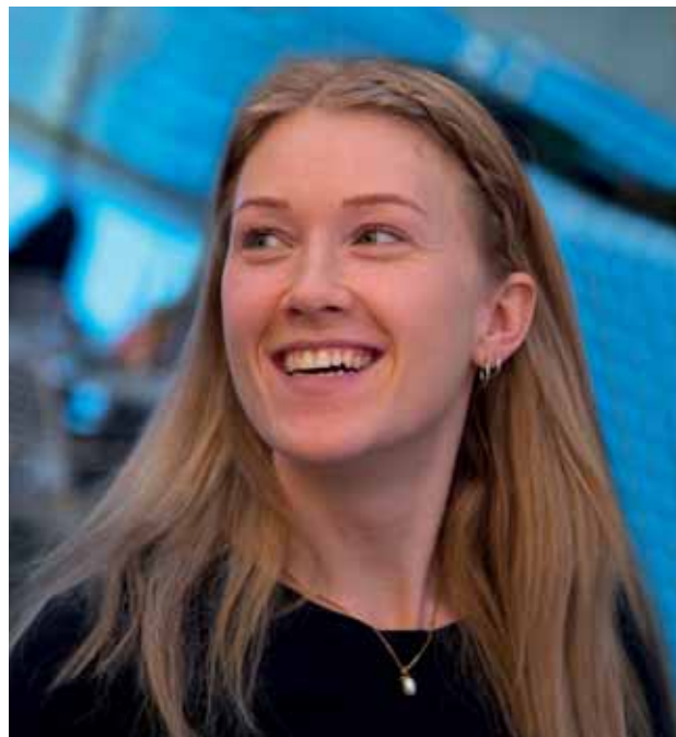
Tilbake til Sverige, med faglige erfaringer fra Norge.

Ja, ta gjerne også med at hun lenge har drevet med noe såpass spesielt som å interessere seg for kinesiske skrifttegn